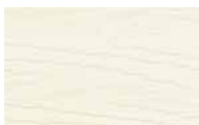
Crème (env. RAL 9001)