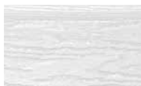
Hellgrau (ca. RAL 7047)