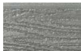
Basaltgrau (ca. RAL 7012)