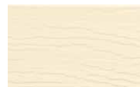
Hellelfenbein (ca. RAL 1015)