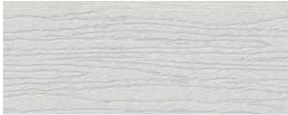
hellgrau / ligh grey / gris clair (ca. RAL 7047)