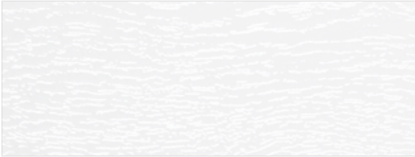
weiß / white / blanc (ca. RAL 9010)