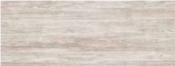
sheffield oak alpin / alpine