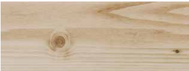
jura pine / pin du jura