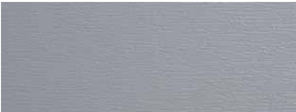
grau / grey / gris (ca. RAL 7001)