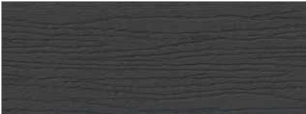
anthrazit / anthracite (ca. RAL 7016)