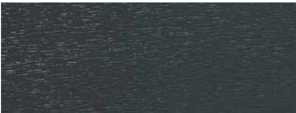
anthrazitgrau / anthracite grey / gris anthracite (ca. RAL 7016)