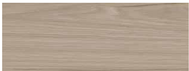
weissbach eiche / weissbach oak / chêne de weissbach