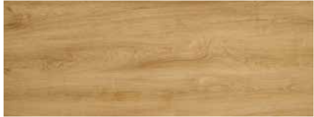
turner oak malz / malt