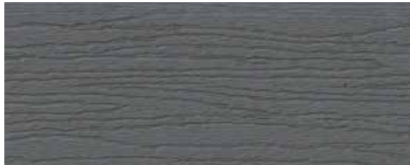
grau / grey / gris (ca. RAL 7001)