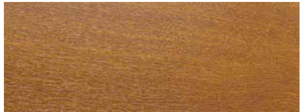
golden oak / chêne doré