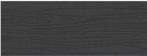
basaltgrau / basalt grey / gris basalt (ca. RAL 7012)