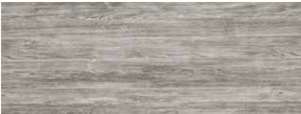
sheffield oak beton / concrete / béton