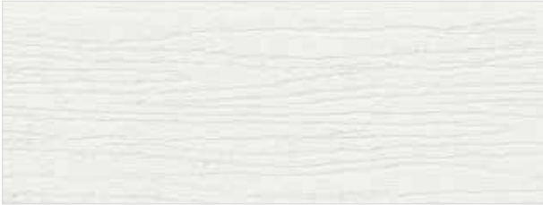
signalweiß / signal white / blanc (ca. RAL 9003)