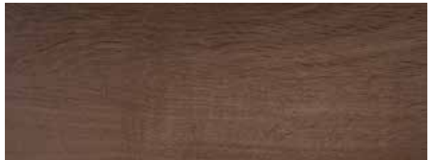
turner oak toffee