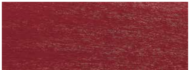
dunkelrot / dark red / rouge (ca. 3011)